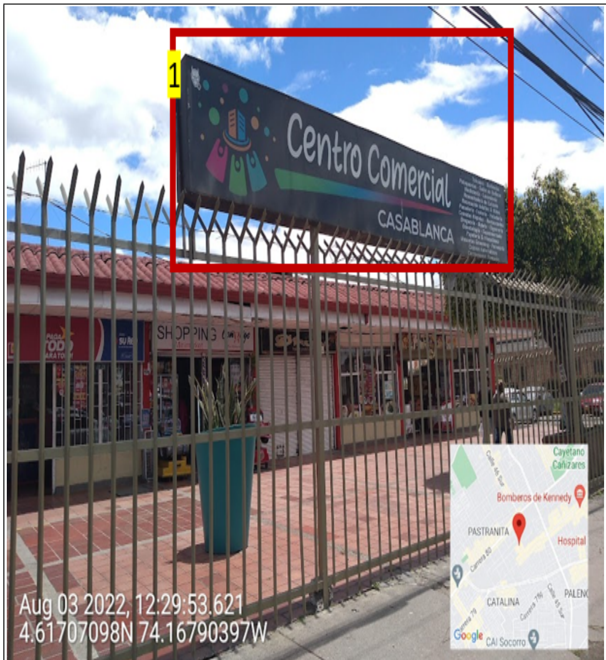
En la que se puede evidenciar: un (1) elemento publicitario instalado sin adosar (volado) a la fachada identificado con el número 1.